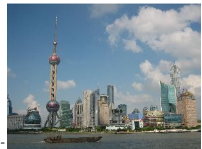
Skyline von Pudong

15.Tag: Do. 21.07.2011 Peking – Shanghai Am Vormittag Flug (ca. 2 Std.) nach Shanghai. Die Metropole im Süden mit 16 Mio Einwohnern ist geprägt von der Kolonialzeit und bietet eine überraschend offene und kulturell vielfältige Atmosphäre. Mit ihren unzähligen, ständig neu entstehenden Wolkenkratzern verkörpert Shanghai das moderne China. Es ist nicht verwunderlich, dass die Stadt den Ruf hat, Hongkong den Rang abzulassen. Wir unternehmen einen Spaziergang durch die Altstadt dabei besichtigen wir das alte Teehaus und den Yu-Garten . Hotel**** (2 Nächte).