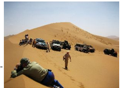
Auf den hohen Dünen

Heute und morgen tauschen wir unseren Bus gegen Geländewagen . Nach 100km erreichen wir bereits die ersten Dünen und unseren Zeltplatz . Die Höhe der Dünen ist zwischen 200m bis über 500m. Unsere geübten Fahrer lassen uns in ihren Allradfahrzeugen förmlich durch die Dünen fliegen. Ein Abenteuer das Sie sich nicht entgehen lassen sollten. Wenn Sie dann noch in der Nacht in den großartigen Sternenhimmel blicken - die Luft ist meistens klar - haben Sie den Himmel auf Erden! *****