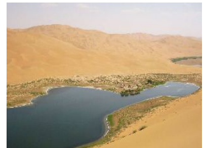
Ein blauer See

Nach einer unvergesslichen Nacht, geht die Wüstenexpedition weiter. Wer möchte, „besteigt“ den mit 520m höchsten Sandberg und saust über die „Sandrutsche“ wieder hinunter. Alternativ steht der Geländewagen zur Verfügung. An einem der blauen Seen gibt es Picknick. Anschließend besuchen wir eine buddhistische Tempelanlage . Am Abend kehren wir nach Alxia Youqi zurück. Hotel** (1 Nacht).