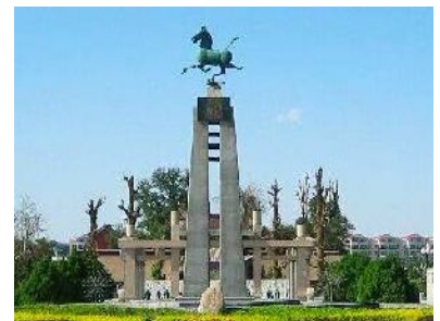
Das fliegende Pferd

Wir verlassen die innere Mongolei und fahren nach Wuwei, einer ehemaligen Station der Seidenstraße. Wir besichtigen den Konfuziustempel und ein Han-Grab (Han-Dynastie 206 v.Chr.- 220 n.Chr.). Im Grab wurde in den Sechzigern das berühmte „ fliegende Pferd “ gefunden. Als Emblem des chinesischen Tourismus findet man es heute auf allen Veröffentlichungen des staatlichen Fremdenverkehrsamtes. Hotel*** (1 Nacht).