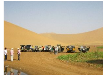
Umsteigen in Geländewagen

Heute steht uns ein „Wüstentag“ bevor. Wir durchqueren die Tengger (mongolisch: „Weiter Himmel“), die erste Teilwüste. Über eine gut ausgebaute Straße durchfahren wir abwechslungsreiche Landschaften und immer wieder begegnen wir Kamelen mit ihren Treibern. In Alxa Youqi beginnt die Badain Jara , die zweite Teilwüste. Sie ist die drittgrößte Wüste Chinas, liegt zwischen 1100 und 1600 Metern ü NN und im Winter liegt sogar Schnee auf den Gipfeln. Sie zeichnet sich durch fünf Besonderheiten aus: Bizarre Bergspitzen, die größten „singenden“ Sanddünen der Welt, klare Quellen, tiefblaue Seen und buddhistische Tempelanlagen aus der Mingzeit (1368 –1644). Hotel** (1 Nacht).