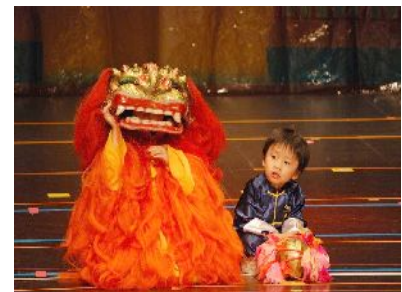
Zai Jian und Ni hao

Wenn Sie mehr Zeit haben und möchten die Gelegenheit nutzen Ihren China Aufenthalt zu verlängern, dann genügt ein Anruf und wir geben Ihnen in kurzer Zeit ein Preisangebot.